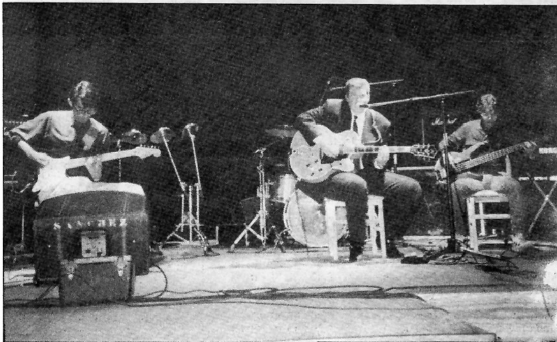
Colectivo de Músicos de Salamanca

Además estos días se comienzan a barajar los posibles artistas que nos visten con motivo de las Fiestas de septiembre. Entre ellos destacar a Víctor Manuel y Ana Belén (otra vez), Isabel Pantoja y El Último de la Fila. Es increíble lo repetitivos que se ponen los responsables de festejos de nuestro Ayuntamiento. Parece ser que sólo saben que traer a artistas que estamos ya hartos de ver cada dos años. Podían hacer una consulta a la gente joven de la ciudad que, al fin y al cabo, son los que abarrotan los locales cuando hay actuaciones. Luego se quejan de que no acudimos a los conciertos. Podían tomar nota de ciudades cercanas, como el caso de León, donde los próximos días se celebran sus fiestas de San Juan y cada noche tienen programado un concierto de grupos de primera línea y grupos locales destinados a la gente joven.