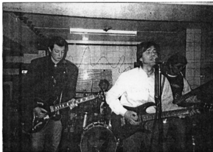
«Paco y Gorrones» actuarán el próximo 26 de marzo.