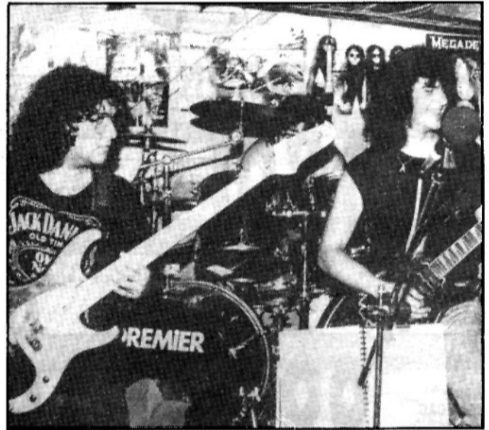
Más de veinticinco grupos ensayan en los locales de La Salle

El principal problema al que el Colectivo se ha enfrentado desde sus inicios es «que no podemos ensayar». De todas maneras, es posible que cuando el edificio de La Salle esté a punto se vean recompensados.