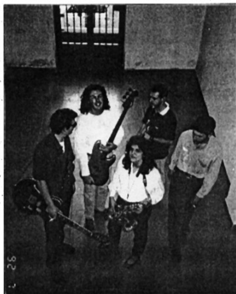
«Expres soul Banda», grupo perteneciente al colectivo.