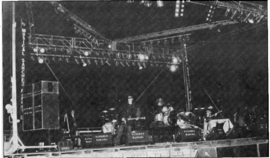
Concierto en favor de la Asociación contra la Leucemia.

El broche final lo pusieron «Abuelo Jones» que realizaron su repertorio Pop-Rock y «Berro-